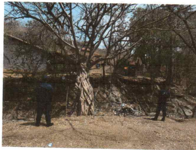
Imagen 4: Verificación domiciliaria en la localidad de Ceiba Seca

COMO PARTE DE LAS ACCIONES EN MATERIA DE APOYO INTERINSTITUCIONAL, SE DA EL APOYO A LA FISCALÍA GENERAL DEL ESTADO Y A LA FISCALÍA GENERAL DE LA REPUBLICA EN ENTREGAR NOTIFICACIONES, HACER VERIFICACIONES DOMICILIARIAS Y ACOMPAÑAMIENTOS.