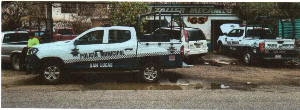
Imagen 5: Mantenimiento de unidades móviles.

SE REALIZÓ EL MANTENIMIENTO CORRECTIVO Y EL MANTENIMIENTO PREVENTIVO A TODAS LAS PATRULLAS LAS CUALES SE ENCUENTRAN A RESGUARDO DE LA DIRECCIÓN DE SEGURIDAD PÚBLICA MUNICIPAL.