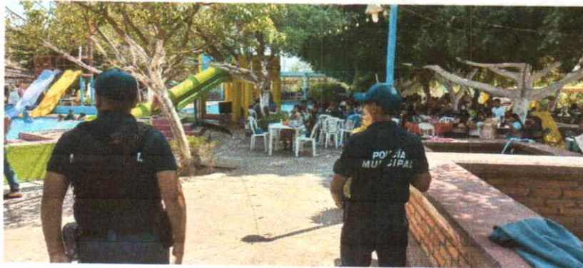
Imagen 1: Rondines de vigilancia en un balneario público.

COMO PARTE DE LAS ACCIONES PARA MANTENER EL ORDEN PÚBLICO Y EL BIENESTAR SOCIAL, LA CORPORACIÓN REALIZO UN PROGRAMA OPERATIVO PARA SEMANA SANTA 2024 EL CUAL ABARCA DESDE LA ÚLTIMA SEMANA DE MARZO Y LA PRIMER SEMANA DE ABRIL, EN EL QUE SE ESTABLECEN RUTAS PARA REALIZAR LOS RONDINES DE VIGILANCIA Y ATENDER LOS LUGARES CON MAYOR AGLOMERACIÓN DE VACACIONISTAS, TALES COMO BALNEARIOS PÚBLICOS, RESTAURANTES, BARES, RÍOS, ENTRE OTROS.